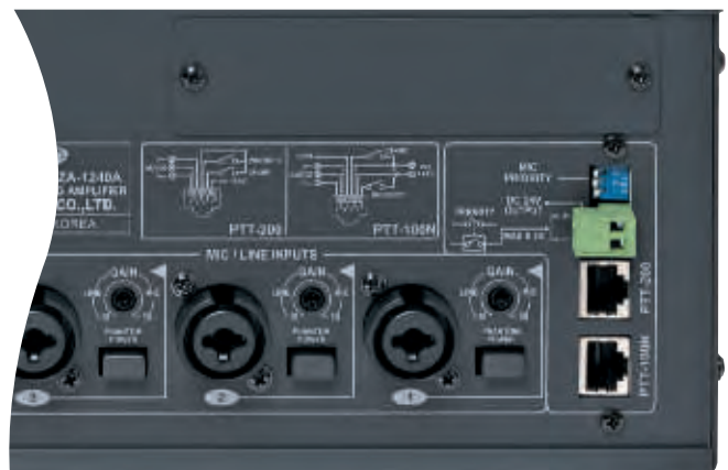
Micro pupitre PTT100N / PTT200 (RJ45)